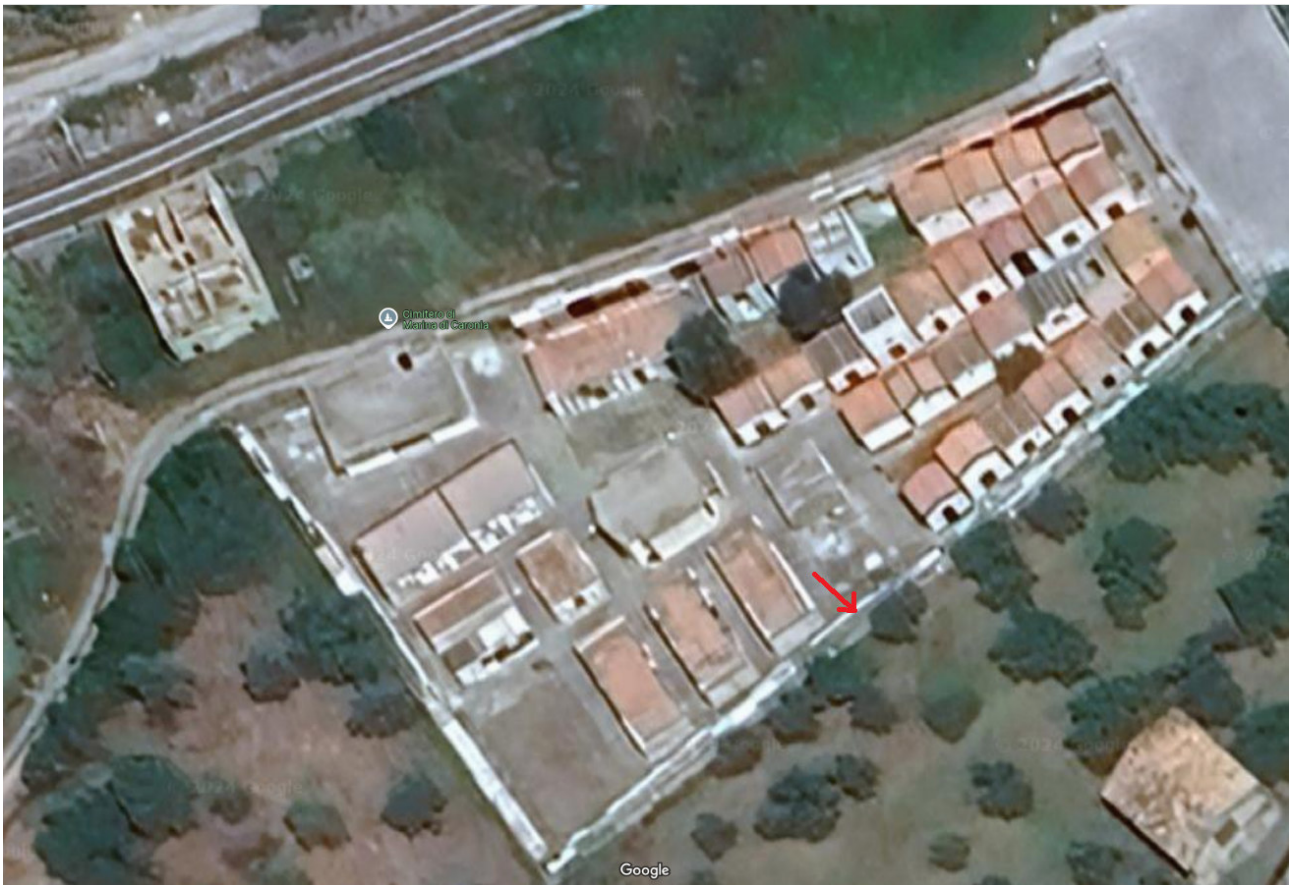
• Foto aerea con individuata l'area in oggetto