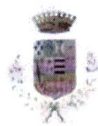
SANTO STEFANO DI CAMASTRA